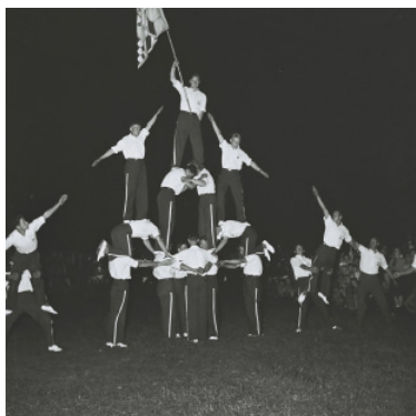
1945 Jonge mannen die een pyramide bouwen,

Naast hard werken deed een aantal jonge boeren ook aan georganiseerd sporten om de conditie op peil te houden. Daarvoor kende de Jonge Boerenstand (RKJB) een sportclub. Die hield zich vooral bezig met turnen.