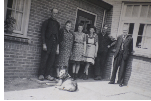
Eentje lijkt een Verduijn.