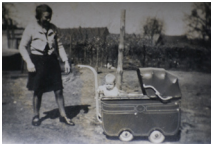
vrouw met een ouderwetse kinderwagen.